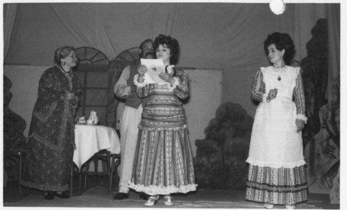
A válogatós leány c. előadás, 1970

A Petőfi Sándor ME munkájával hozzájárult a település hírnevének öregbítéséhez. A tagság szorgalmas és önfeláldozó munkájának köszönhetően eljutott minden szemlére. Állandó kapcsolatot tartott fenn Vajdaság több